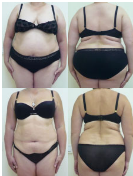
До процедуры и через 5 недель

Мероприятия по детоксикации необходимо проводить значительно дольше того момента, когда у пациента начнется снижение веса, а начинать следует еще на этапе планирования лечения. После достижения желаемого результата пациента следует постепенно вывести из редукционного питания и составить ему план рациона с физиологической калорийностью.