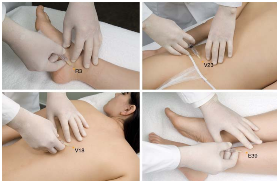
ФОТО 2. Вариант мезотерапевтического введения препарата Gamma Lymphioti

Средства назначаются перорально, по 10–15 капель каждого препарата 3 раза в день в течение 1–2 месяцев. Их также можно вводить парентерально и/или методом фармакопунктуры (фото 1,2). В последнем случае для повышения эффективности процедуры к вышеуказанным препаратам по усмотрению специалиста можно добавить Procainum Oti Composto или Enervital.