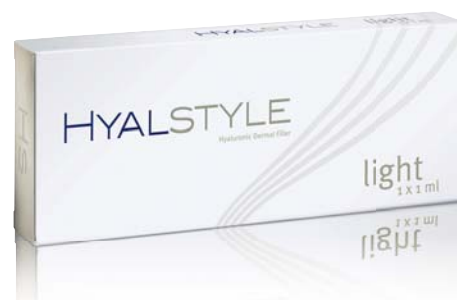
ФОТО 6. Биоревитализант Hyal Style Light нивелирует последствия любого стресса

Light (фото 6), который содержит нативную гиалуроновую кислоту (18 мг/мл) и глицерин (20 мг/мл). Средство вводится интрадермально, папульно или линейно-ретроградно на глубину около 2 мм. При интрадермальном введении высокомолекулярная ГК естественным путем интегрируется в окружающую ткань, восстанавливает влагоудерживающую способность дермы и обеспечивает оптимальные физиологические условия для функционирования фибробластов. Диффундирующий в эпидермис глицерин восстанавливает барьерную функцию кожи, нормализует синтез липидов. Процедуры проводят каждые 7 дней, чередуя их, курс включает 4–6 сеансов.