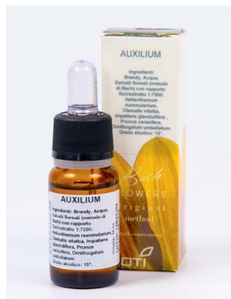
ФОТО 4. Флоратерапевтическое средство Auxilium предотвращает негативные последствия любого стресса

Биологическая anti-age терапия должна использоваться вместе с современными инъекционными (биоревитализация, мезотерапия, контурная пластика, ботулинотерапия, нитевой лифтинг) и аппаратными методами эстетической коррекции, а также пилингами и программами косметического ухода.