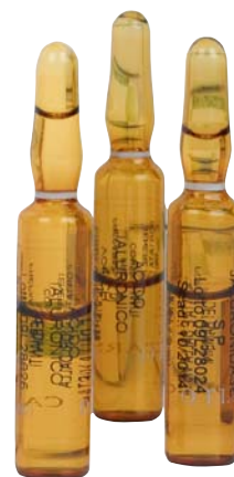
ФОТО 5. Антигомотоксический коктейль H2-Oticatal

Через неделю проводится процедура классической биоревитализации, например с использованием препарата Hyal Style