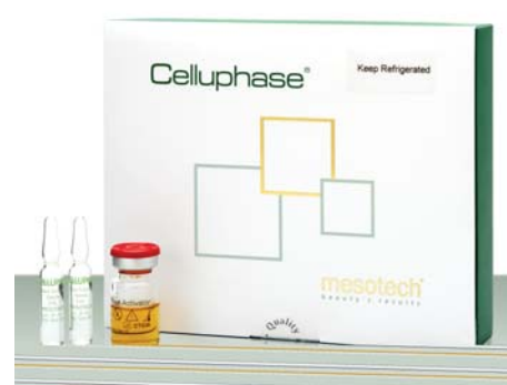
ФОТО 6. Мультиактивный коктейль Celluphase