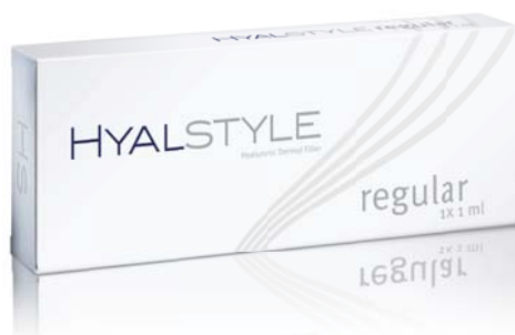
ФОТО 7. Филлер Hyal Style Regular