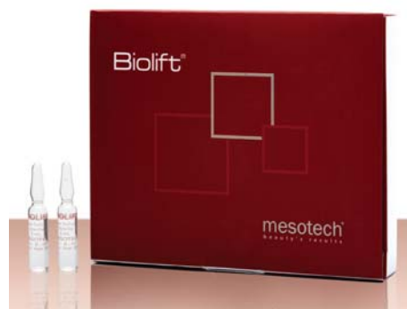
ФОТО 5. Мультиактивный коктейль Biolift