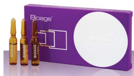
ФОТО 2. Мультиактивный коктейль Bioage