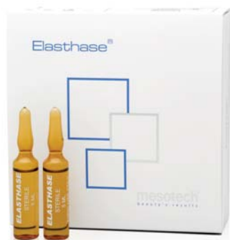
ФОТО 4. Мультиактивный коктейль Elasthase

Кроме того, средство можно назначать пациентам со вторым подбородком, избытком подкожно-жировой клетчатки лица и тела любой локализации, а также при гипонидной липодистрофии.