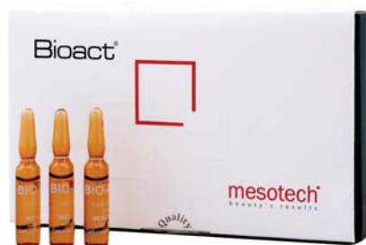
ФОТО 1. Мультиактивный коктейль Bioact

На российском рынке популярностью пользуются мультиактивные мезококтейли итальянского фармацевтического концерна Mesotech , которые зарекомендовали себя как эффективные и безопасные мезотерапевтические средства. Они успешно применяются и в периорбитальной области.